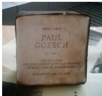
Dieser Stolperstein erinnert an Paul Goesch

persönlichen Schicksalen durch die Schüler ersetzen. So wird die Gestaltung von Einzelbiographien noch einmal eine spezielle Aufgabe für die Schüler zu einem späteren Zeitpunkt darstellen!