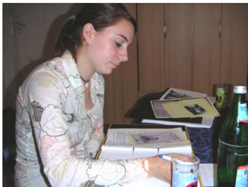
Bei den Vorbereitungen für die Ausstellung

Fotobestände: Auf „Erfassungsfotos“, die den Blick der „Täter“ kennzeichnen – und auf Privatfotos der ehemaligen ZwangsarbeiterInnen. Diese beiden Fotogruppen haben wir analysiert und verglichen.