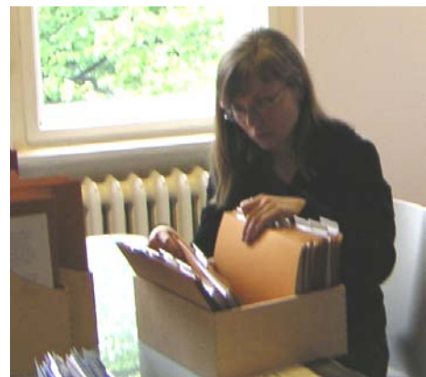
Recherche im Jugendmuseum Schöneberg

Das zweite Treffen fand im Jugendmuseum Schöneberg statt. Dort wurde vor zwei Jahren eine Ausstellung zum Thema Zwangsarbeit in Schöneberg entwickelt. Sie befindet sich in der Bibliothek des Museums. Die Ausstellung wird Schüler- und anderen Jugendgruppen als Arbeitsmaterial zur Verfügung gestellt. Wir suchten dort – neben der Sichtung der Ausstellung - nach geeigneten Fotos, die wir für unsere Ausstellung benutzen könnten. Mit dem zusammen gestellten Material haben wir uns dann mehrmals für die Gestaltung der Ausstellung getroffen. Wir beschränkten uns schließlich auf zwei