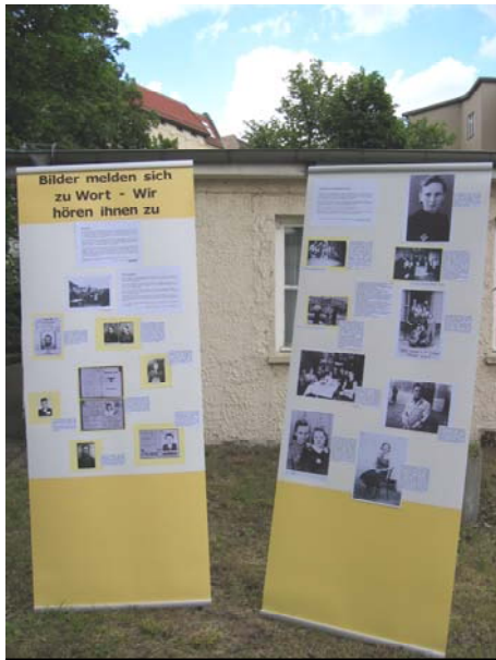
Präsentation der Fotoausstellung von den Abiturientinnen der Gesamtschule Paul-Dessau