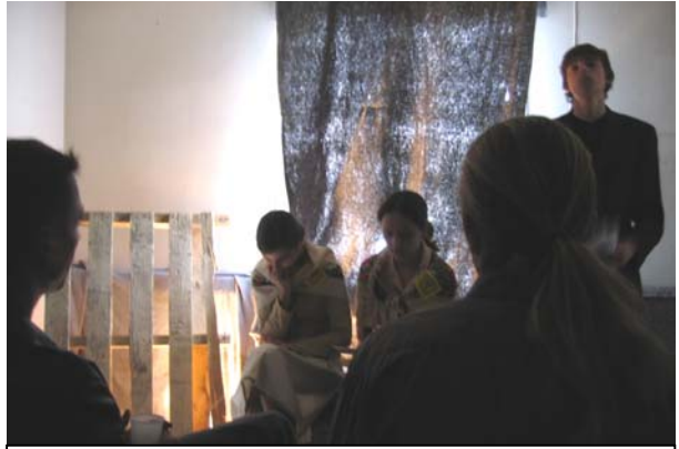
Ein Schüler (r.) ,unterbrach' die Lesung immer wieder mit NS-Verordnungen für die ZwangsarbeiterInnen