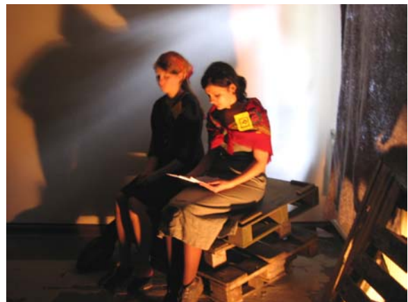
Sie bespielten vier Räume und lasen jeweils zu zweit Auszüge aus Briefen vor