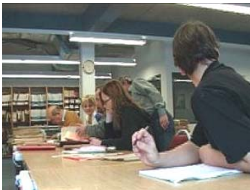
Einsicht in Originaldokumente im Brandenburgischen Landeshauptarchiv