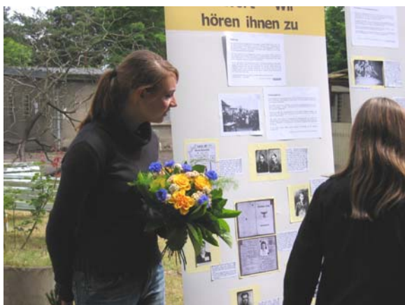
Sie wird als Wanderausstellung auf Reise gehen