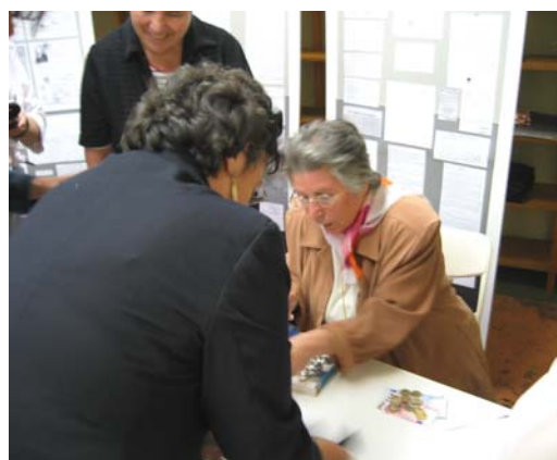
Sie musste als junges Mädchen bei Salamander Zwangsarbeit leisten