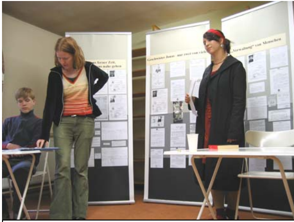
Im Anschluss stellten die Jugendlichen aus Königs-Wusterhausen ihre Ausstellung vor