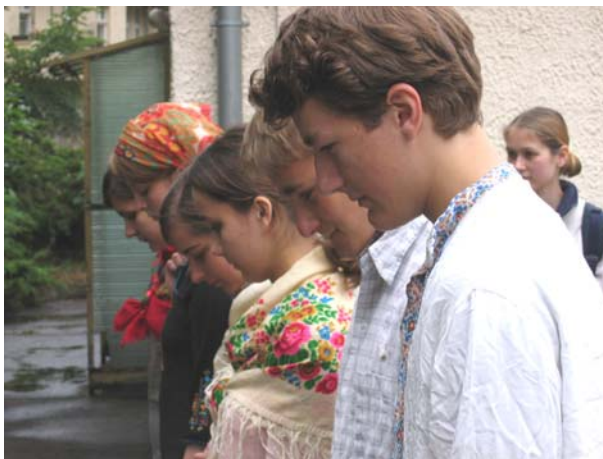
Die SchülerInnen des Archenhold-Gymnasiums beginnen die szenische Lesung vor der Baracke