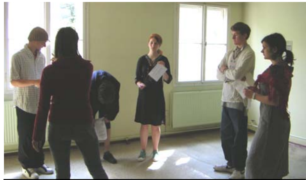
Besprechung der Inszenierung in den Baracken

SchülerInnen der Arbeitsgemeinschaft beitreten, die sich als einzige Gruppe in der Schule mit der Geschichte der Zwangsarbeit, explizit mit der Zwangsarbeit im Bezirk Schöneweide auseinandersetzt, bedeutet, dass die Arbeit der Jugendlichen sinnvoll und mutig ist. Diese Arbeit wollten wir durch dieses Projekt unterstützen.