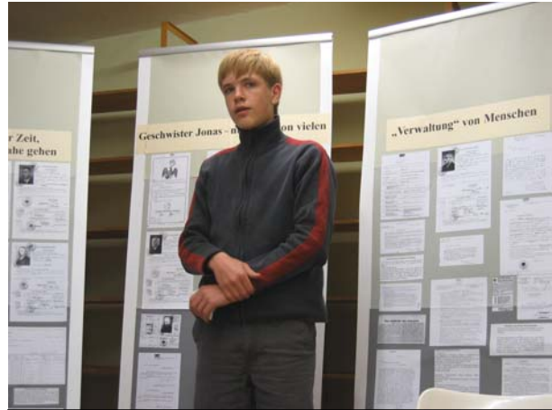
Jede/r präsentierte die Ergebnisse der eigenen Recherche