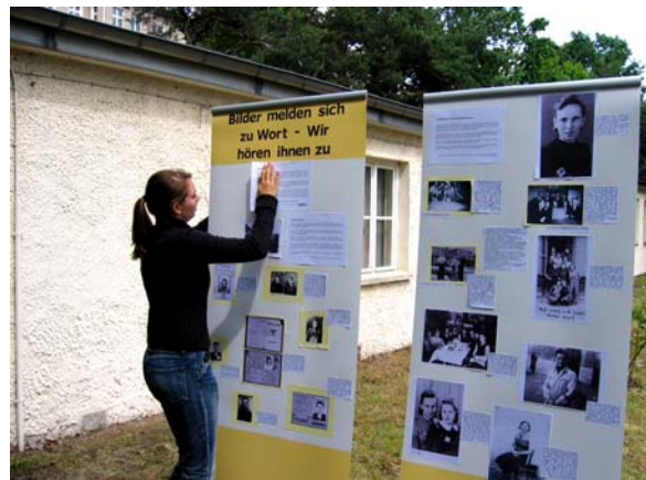
Titel der Ausstellung: Bilder melden sich zu Wort – Wir hören ihnen zu