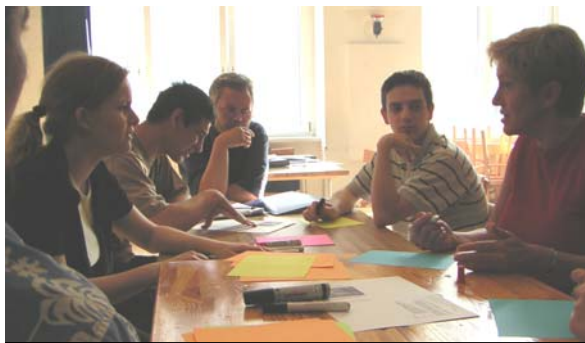
Erstes Treffen in den Räumen des Jugendclubs Schalash

Geplant war mit den Jugendlichen, die in der Zeitungsgruppe aktiv sind, sich dem Thema NS-Zwangsarbeit mithilfe von unterschiedlichen Zugängen anzunähern. Es sollte einen Einstieg in das Thema, einen Rundgang über das ehemalige Barackenlager in Schöneweide und die Gestaltung einer Homepage geben.