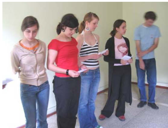
Im letzten Raum berichteten die Jugendlichen von ihrer Begegnungsfahrt nach Polen 2003