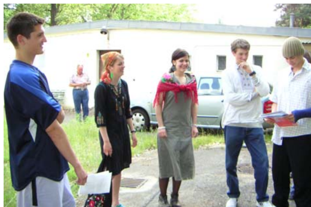
Bei den Proben auf dem Gelände

Arbeitsgemeinschaft „Zwangsarbeit während der NS-Zeit“ gegründet. Im April 2003 führte die Berliner Geschichtswerkstatt zusammen mit dem Bund der Antifaschisten Treptow und der gesamten Arbeitsgemeinschaft eine Begegnungsfahrt nach Łódź/Polen durch 1 . Sie hatten dort die Gelegenheit, Gespräche mit ehemaligen ZwangsarbeiterInnen zu führen. Der Wunsch der Projektgruppe war, einmal eine szenische Lesung mit Briefen ehemaliger ZwangsarbeiterInnen zu gestalten.