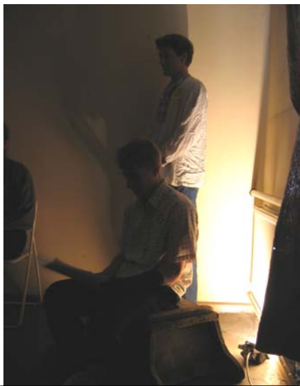
Der dritte Raum