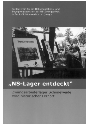
Broschüre des Fördervereins, erschienen 2006

Die Errichtung des Dokumentationszentrum NS-Zwangsarbeit Schöneeweide ist ein Erfolg zivilgesellschaftlichen Engagements. Seit Anfang der 1990er Jahren setzen sich Einzelpersonen und Initiativen wie die Berliner Geschichtswerkstatt e. V., der Bund der Antifaschisten Treptow e. V., die Kulturlandschaft Dahme-Spreewald e. V und die Stadtplangemeinschaft Dubach/Kohlbreuner für den Erhalt der Steinbaracken und die Errichtung eines Lernortes ein. Im Juli 2001 bildete sich aus diesen Initiativen ein Förderkreis für ein Dokumentationszentrum, aus dem der im Juni 2004 im Berliner Abgeordnetenhaus gegründete Förderverein hervorging.