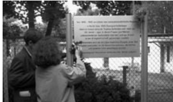
Einweihung der Gedenktafel, Juli 2001

Seit 1994 setzen sich die Berliner Geschichtswerkstatt, der Bund der Antifaschisten Treptow und andere Initiativen dafür ein, die Baracken zu erhalten und angemessen zu nutzen. Seit Ende 2000 liegt ein erster Konzeptionsentwurf vor.